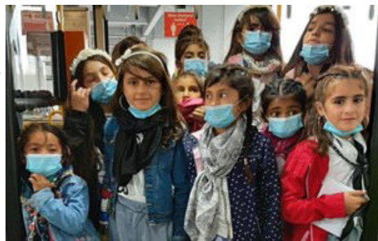
Noch September 2020 konnten 56 Mädchen und Jungen nach ihrer medizinischen Behandlung in ihre Heimat Afghanistan zurückkehren.