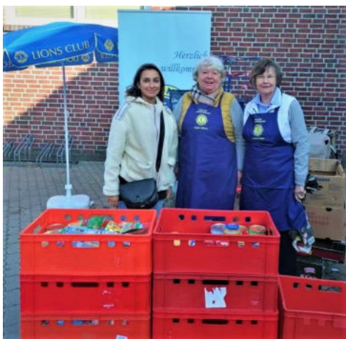
Die Damen des LC Rheurdt/Niederrhein sammelten 67 Banenkisten für die Tafel

Auch in diesem Jahr animierten die Damen des Lions Clubs Rheurdt/Niederrhein viele Menschen bei ihrem Wochenendeinkauf, Gutes zu tun. Im Rahmen der Aktion „Ein Teil mehr“ konnten im Oktober Spenden, wie zum Beispiel haltbare Lebensmittel oder Hygieneprodukte abgegeben werden, die der Club über die Vluyster Tafel an Bedürftige spendete. An zwei Standorten des Marktes Edeka Raber in Neukirchen und Vluyn wurden so insgesamt