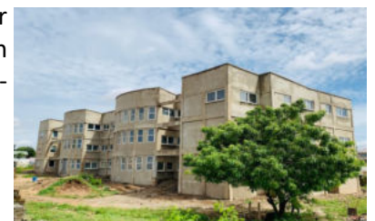
Rohbau in 2021

Auf der Distriktversammlung wurde einstimmig beschlossen, für diese Einrichtung ein Spendenkonto einzurichten.