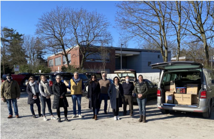
Der LC Düsseldorf–Schloss Kerkum i.G. sammelte 16 Wagenladungen voller Spenden mit der größten Grundschule Düsseldorfs

Außerdem ist eine große Spendenaktion mit den beiden Gymnasien im Stadtteil Kaiserswerth geplant.