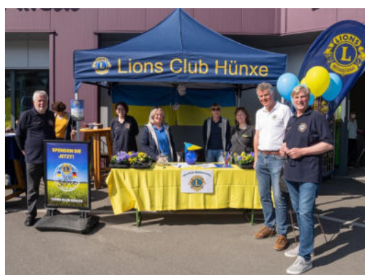
Spendenaktion vor einem Supermarkt

Zudem hat eine spektakuläre Ballon-Aktion stattgefunden: Ballons in Nationalfarben der Ukraine wurden mit Helium gefüllt und jeder Spender konnte eine Karte mit Wünschen für die Ukraine schreiben und diese mit einem Ballon "versenden".