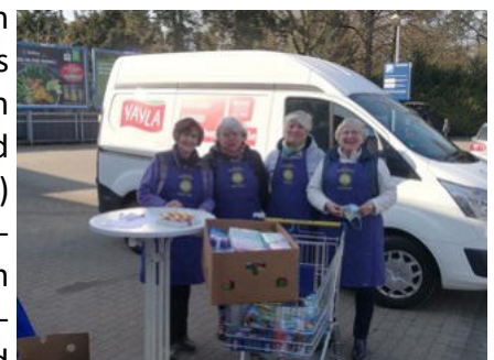
Ein-Teil-mehr-Aktion für Flüchtlinge vor Ort

(bisher) mir den Städten Moers und Neukirchen in Kontakt und auch (vorerst) allen Grundschulen. Je nachdem wie es angenommen wird und wie der Bedarf ist, kann die Aktion natürlich noch erweitert werden.