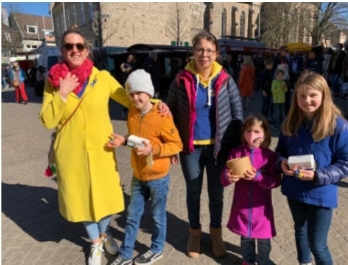
Die Schleifen werden in der Innenstadt von Ratingen verteilt

Neben dem Einsatz jedes einzelnen Lions des LC Ratingen-Ratinger Tor , wurden Kinder- und Winterkleidung an verschiedene gemeinnützige Vereine und Organisationen gespendet. Außerdem haben alle Lions des Clubs mit ihren Familienangehörigen Schleifen in den Nationalfarben der Ukraine hergestellt. Alle Teilnehmer verteilen diese Schleifen gegen eine kleine Spende in der Ratinger Innenstadt, an mindestens zwei Samstagen.