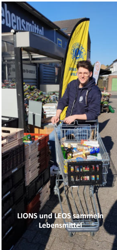
LIONS und LEOS sammeln Lebensmittel

Das Resultat dieser Aktion war überwältigend. Es kamen mehr als 2.500 Produkte zusammen. Fast jeder Spender lieferte mehrere Waren ab, einige ganze Einkaufswagenladungen. Vorsichtige Schätzungen gehen von einem Warenwert von 4.000 bis 5.000 Euro