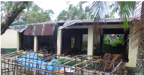
Vom Tsunami zerstörte Schule