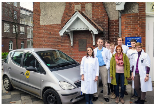
Die Mitarbeiter der Lions Hornhautbank NRW

und den Lions-Freunden feiern. Hierbei sollen die Leistungen der Vergan-