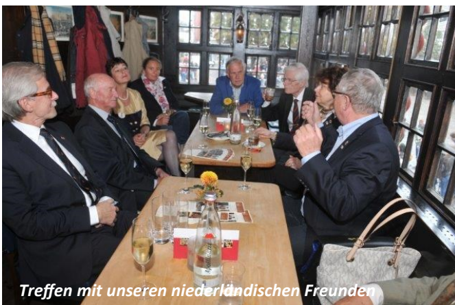
Treffen mit unseren niederländischen Freunden