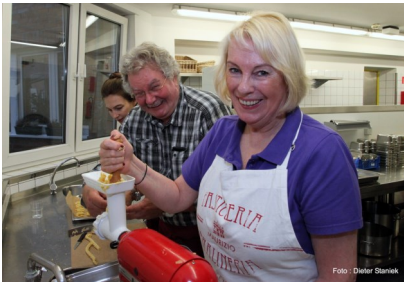
Spritzgebäck hat Tradition auf Schloss Dyck.

Weil im Rheinland ja alles Tradition hat, was dreimal stattgefunden hat, hat der Plätzchenverkauf des LC Neuss-Obertor beim Weihnachtsmarkt auf Schloss Dyck bei Jüchen definitiv den Zusatz „traditionell“ verdient! Seit 2009 backen die Lions Spritzgebäck und Kokosmakronen, um sie auf der weit über den Rhein-