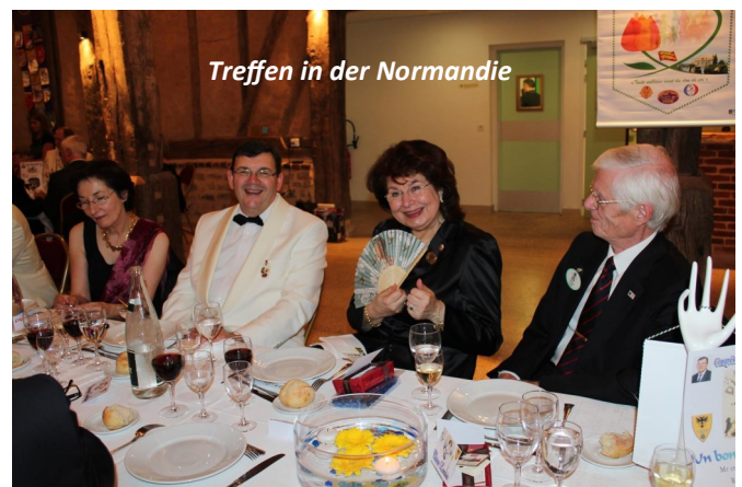
Treffen in der Normandie

Eine kleine Delegation von RS und RN traf sich am 8. Oktober mit unseren holländischen Freunden aus dem Distrikt CO in Aachen. In der eindrucksvollen Kaiserstadt wurden Erfahrungen ausgetauscht und Anregungen gegeben.