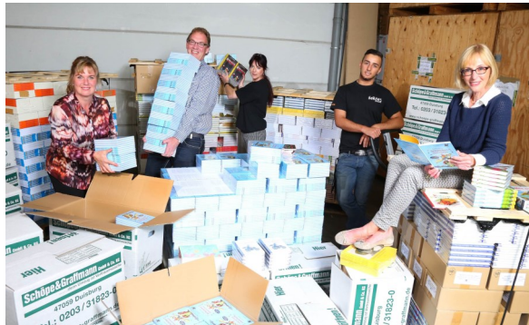
Beim Kommissionieren der 9.000 Bücher für den guten Zweck.

burger Kindern im Alter von fünf bis zehn Jahren zugute, die sich