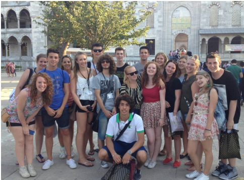
Teilnehmer des Jugendaustausches im Jahre 2013 Camp Bursa, Türkei

In ein paar Wochen beginnt wieder die Registrierung für den Jugendaustausch, an dem Jugendliche im Alter von 15 bis 25 Jahren teilnehmen können, wobei die Plätze für 15-Jährige sehr begrenzt sind. Dieses Lions-