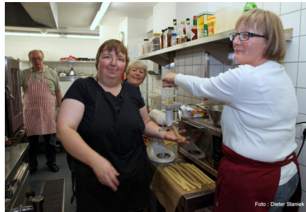
LC Neuss-Obertor: Backen für den guten Zweck

Kreis Neuss hinaus beliebten, stimmungsvollen Schlossweihnacht zu