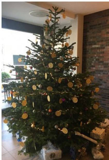
Jede Kugel eine Spende für Kinder aus Rheinberg

Inzwischen ist es schon Tradition geworden: zum 6. Mal erstrahlte am 1. Advent ein Weihnachtsspendenbaum im Foyer des Hotels am Fischmarkt in Rheinberg. Geschmückt war er mit goldenen Anhängern mit frohen Wünschen zum Weihnachtsfest. Auf deren Rückseite waren Beträge über 5 €, 10 € und 20 € aufgedruckt. Nicht nur Hotelgäste sondern alle, die am Hotel vorbeikommen, waren eingeladen, einen Anhänger „abzupflücken“ und den aufgedruckten Betrag oder gerne auch mehr an der Anmeldung des Hotels als Spende zu entrichten. Der aufgedruckte QR-Code ermöglichte natürlich auch, die Spende bequem per PayPal einzuzahlen. Wer allerdings in den nächsten Wochen nicht am Hotel am Fischmarkt, Fischmarkt 2-5 in 47495 Rheinberg vorbei kam, konnte