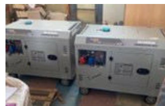
Die beiden Notstromaggregate sind besonders im Winter wichtige Faktoren für die Energieversorgung

Die Beschaffung erfolgte dabei über unsere bewährten Partner – Ukraine-Hilfe-Berlin e.V. und Initiative E+ vor Ort. Beide Organisationen gewährleisteten die Beschaffung und den sicheren Transport nach Worsel. Die Mittel konnte der Club aus frei verfügbaren Spenden und durch eine großzügige Einzelspende aufbringen.