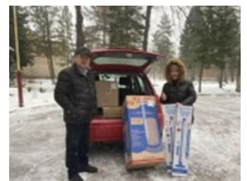
Rechtzeitig zu Beginn des Winters konnten die Warmwasserspeicher und UV Lampen geliefert werden

Aufgabe der Klinik ist die psychiatrische Behandlung von Soldaten und Zivilisten aus den Frontregionen, die unter starken posttraumatischen Belastungsstörungen leiden. Sie haben aufgrund der schlechten hygienischen Situation vor Ort gehäuft Tuberkulose Erkrankungen.