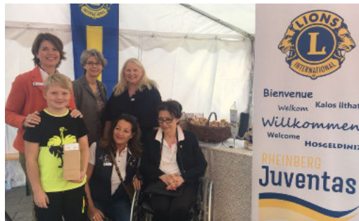
Auf dem Kastanienfest stellten sich die Damen des LC Rheinberg-Juventas vor

Die strahlenden Gesichter der Kinder, als sie ihren Trost-