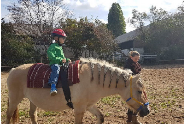
Bei wunderschönem Wetter lud der LC Düsseldorf-Barbarossa behinderte Kinder auf's Land ein

zu einem „Ausflug auf's Land“ eingeladen. Zum liebevoll zusammengestellten Programm gehörte neben der Abholung der Gäste an der Haltestelle „Kalkumer Schlossallee“ mit einem Planwagen und anschließender Fahrt über die Felder zu einer privaten Reitanlage nach Angermund natürlich das Reiten auf einem Pony. Bei strahlendem Wetter gab's außerdem Kaffee, Kuchen und Würstchen vom Grill