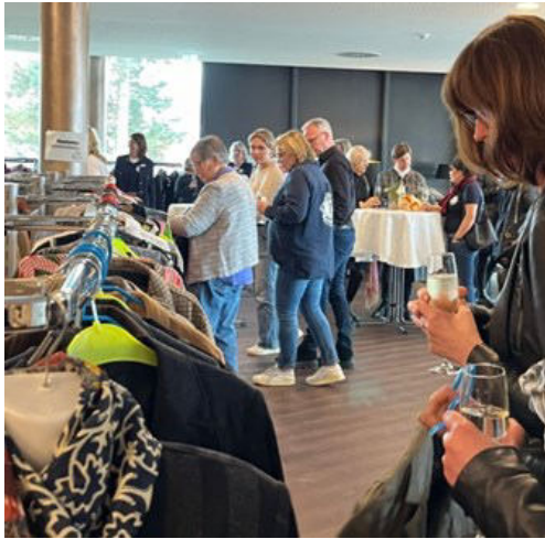
Nach der Kinovorstellung durfte noch ausgiebig eingekauft werden – natürlich ebenfalls für den guten Zweck.