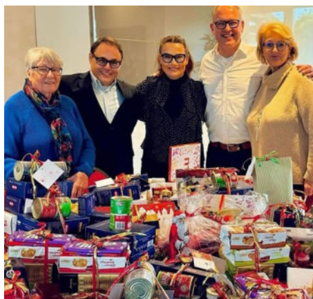
Mitglieder des LC Düsseldorf-Altstadt übergeben einen bunten Berg an Geschenken

Die Idee dazu kam bei einem Austausch von Herzwerk-Mitarbeitenden und Lions Club Mitgliedern am Rande eines Clubabends, bei dem die Arbeit und