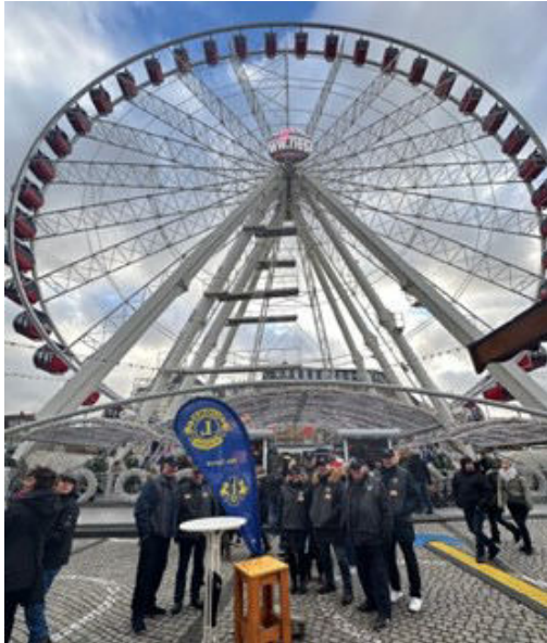
Die Mitglieder des LC Düsseldorf-Barbarossa warteten am 2. Adventssonntag vor dem Riesenrad auf fast 140 Kinder

Ab 11 Uhr bis nach 13 Uhr sammelten sich die Familien am deutlich sichtbaren Lions-Tisch vor dem Riesenrad, um sich dort die Tickets abzuholen für eine Fahrt über die Dächer Düsseldorfs. Damit nicht genug, es gab zusätzlich Gutscheine für eine Bratwurst mit Brötchen und ein alkoholfreies Getränk nach Wahl für jeden, denn was wäre der Besuch eines Weihnachtsmarktes ohne eine solche klassische Stärkung. Da das soziale Umfeld der eingeladenen Familien einen solchen vorweihnachtlichen Ausflug finanziell nicht so einfach ermög-