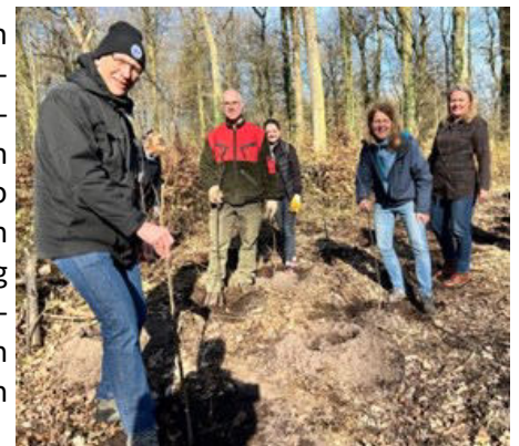
Der LC Duisburg-Hamborn pflanzte erfolgreich 400 Bäume in Duisburg